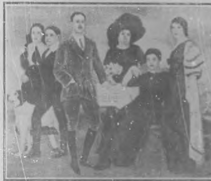
"Mi Familia". Cuadro de Federico Beltrán, que obtuvo medalla de oro en la Exposición de Santiago, 1909; la única medalla de oro que se consiguió en la Exposición de México, 1910, y distinción de primera clase en la Exposición Nacional de Madrid, 1912.—Hizo concursó en la Exposición Internacional de Gante, 1913.

Siendo sus triunfos tan ruidosos como merecidos, su mo-