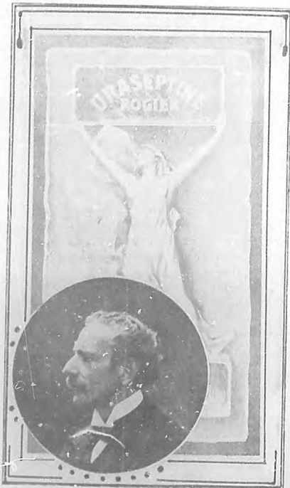
Último retrato del ilustre médico cubano Dr. Joaquín Albarrán Rogier dentro de una alegoría: ve usa el producto "Urapsetine Rogier" afamado patente, en cuya preparación puso nuestro ilustre compatriota todo su amor y saber.