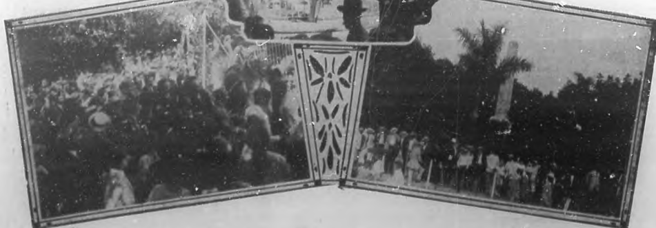
EN HONOR DE LOS HEROES DE LA PATRIA. —Diversos aspectos de la romería patriótica al Cacahual como ofrenda amorosa á los mártires de la Independencia patria, general Antonio Maceo y el capitán Francisco Gómez Toro.

lección de material publicable y en la forma amena y correcta en que está redactado. Tiene el prestigio de la firma valiosa del periodista culto señor Manuel Márquez Sterling y de un grupo de escritores de alto renombre en el mundo de las letras. Es interesante este buen dia-