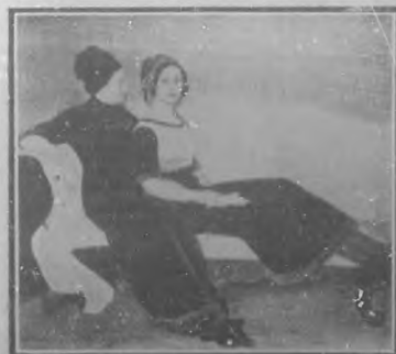
Retrato de la señora Narezo é hija, cuadro de Federico Beltrán, premiado con medalla de oro en la Exposición Internacional de Barcelona, de 1911.—Hizo concursó en la Exposición Internacional de Gante.