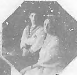
La Zarina, con el Gran Duque Alexis. Es la nieta de la Reina Victoria.

El Gran Duque Alexis, heredero forzoso al trono de todas las Rusias. Nació el año de 1904. Es la hija mayor del Zar y la Zarina. Es una buena niña y coronela de un regimiento de Ulanos. Tiene 16 años.