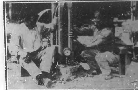
Lugar donde se ha encontrado un yacimiento de petróleo en los terrenos de "La Tropical". Vista de los trabajos ejecutados en los destierrados del terreno.

Homenaje al Sr. Montoro. —Entrega de una casa.—El miércoles se hizo entrega al Dr. Rafael Montoro de la primera casa que para él adquirió el Comité Ejecutivo del Homenaje Nacional á tan ilustre orador.