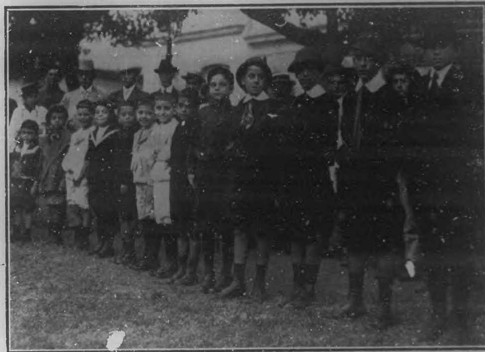
Grupo de los primeros niños inscritos para las carreras de automóviles infantiles organizadas por BOHEMIA.